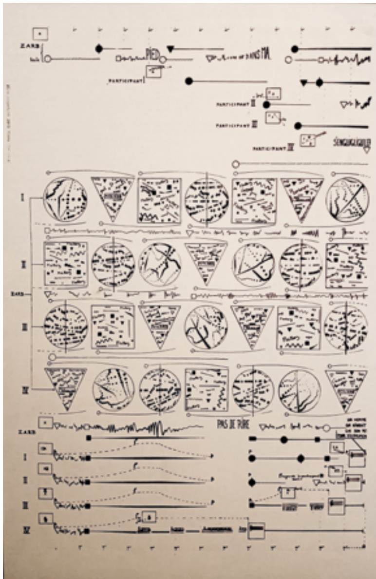
Extrait de reproduction de partition S'enguglgloler sur tissu