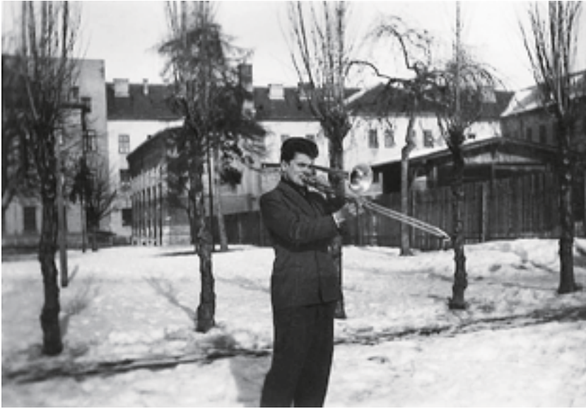
Devant l'internat du lycée (16 ans), début de ses études musicales au conservatoire de Ljubljana, vers 1949-1950