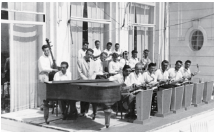
Big band étudiant de Ljubljana, concert l'été, vers 1950