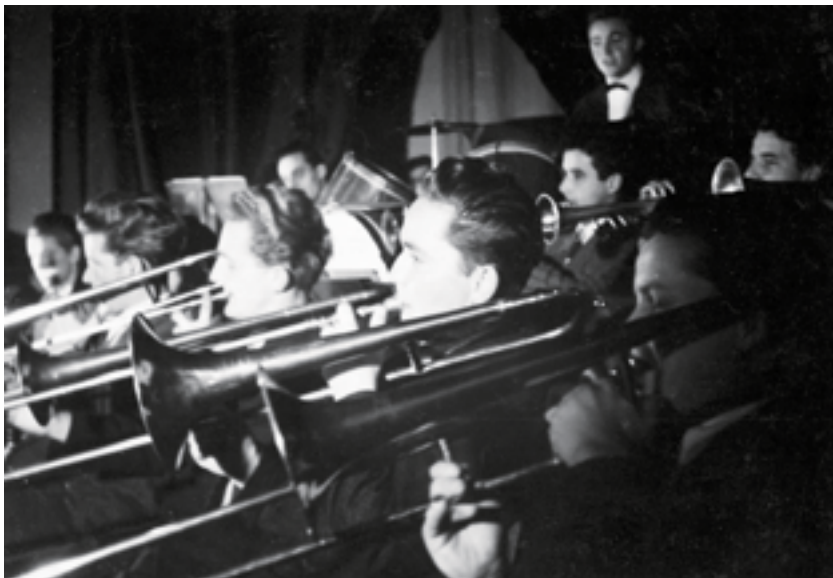
Orchestre symphonique du conservatoire de Ljubljana, vers 1950