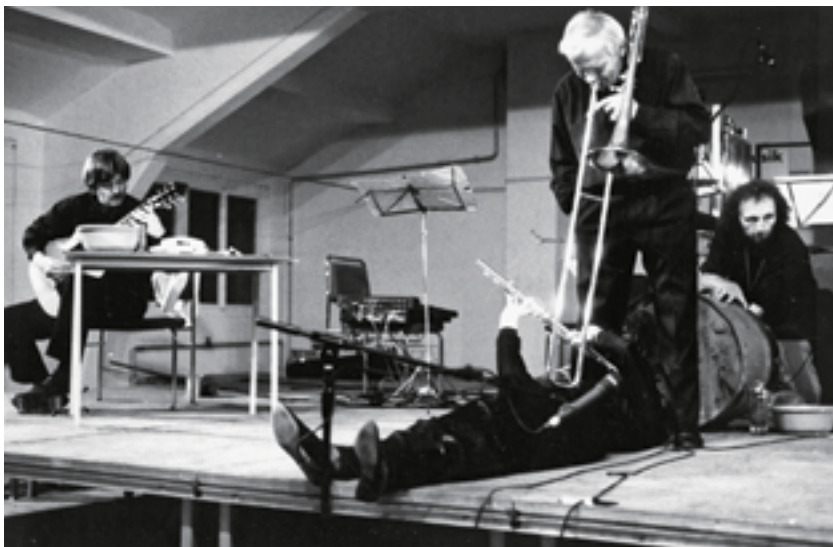
Improvisation sur la pièce Par une forêt de symboles (1986), Dresde 1993