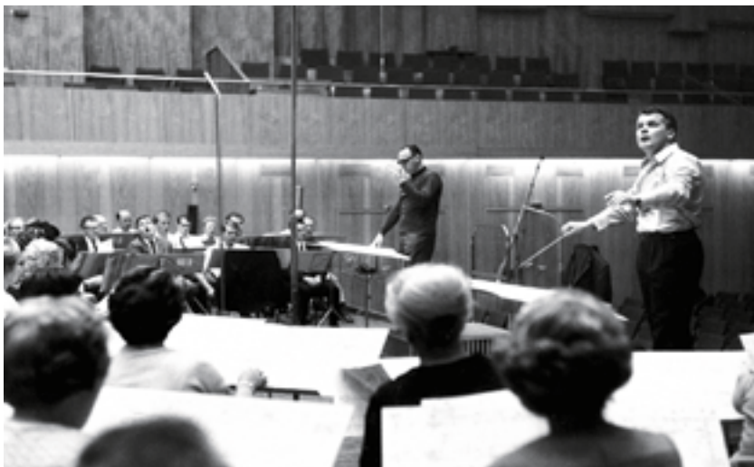
Berlin, avec le chef d'orchestre et compositeur Michael Gielen, 1967