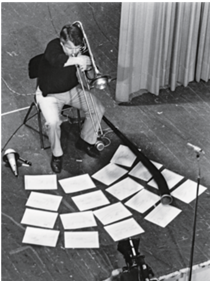
Vinko Globokar interprète Atem de Mauricio Kagel. Darmstadt, 1970