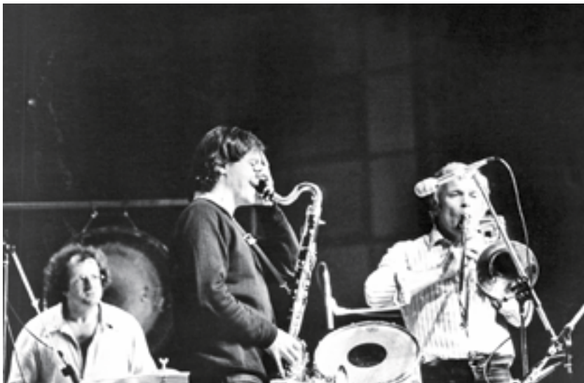
New Phonic Art : Jean-Pierre Drouet, Michel Portal, Vinko Globokar, 1974