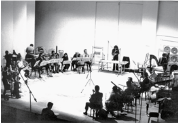
Ausstrahlungen , Festival international à Royan, orchestre Musique vivante, soliste Michel Portal, 1971