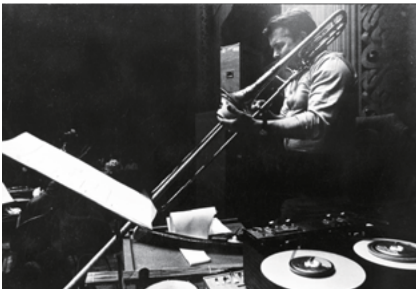
Concerto grosso, à Cologne, 1970