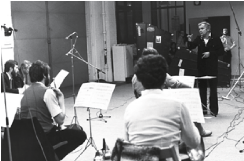
La leçon de musique, Ircam, 1978