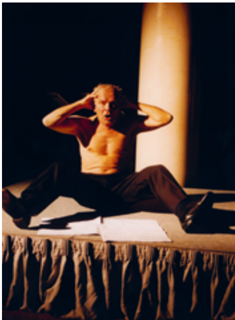
Corporel , performance musicale de Vinko Globokar, 1984, représentation à Londres, 1994