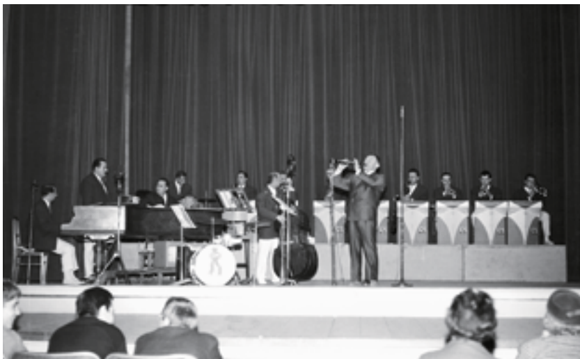
Orchestre de Camille Sauvage