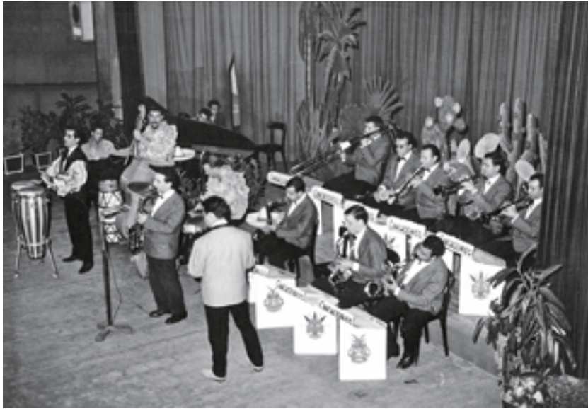
Big Band "Cungaceiros" Paris, 1959