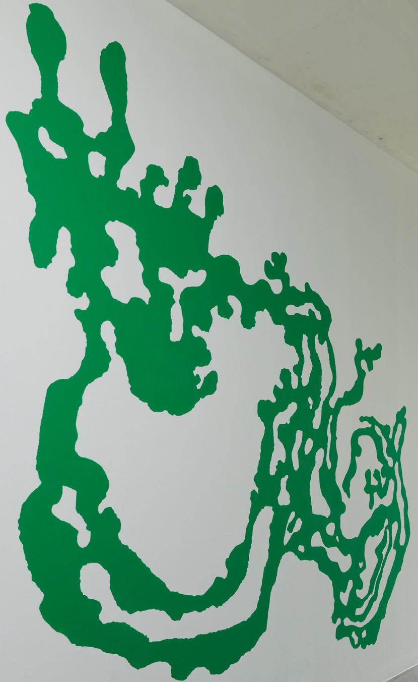
Lois Weinberger, Path-subversive conquest of area , 2001