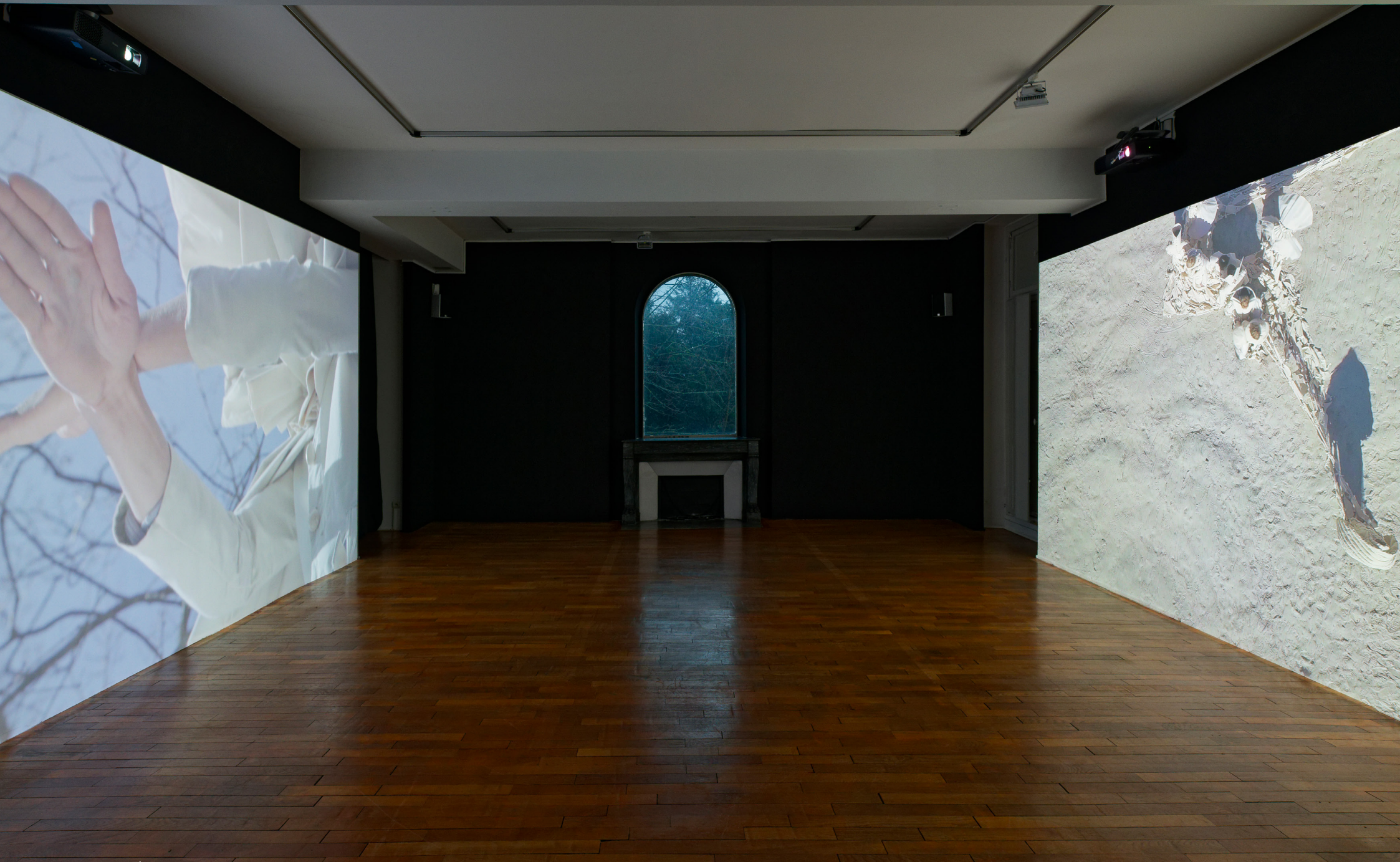
Nefeli Papadimouli, Être Forêts , 2021