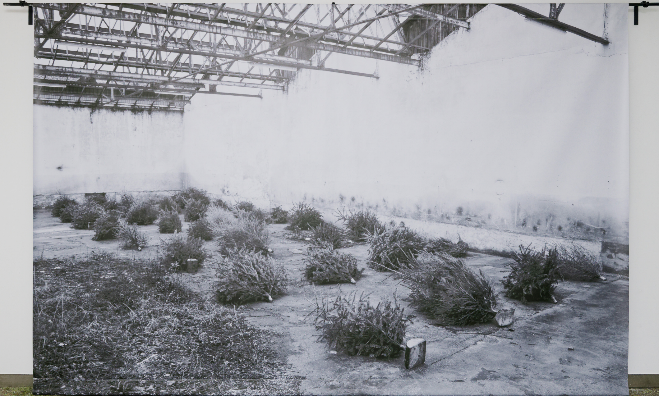
Lucie Douriaud, Abies Nordmanniana, Cimetière , 2014. Impression numérique