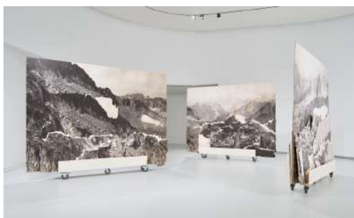
Les témoins, Isabelle Ferreira, MAAT Lisbonne

Depuis 2011, la Fondation développe une politique volontaire de mécénat, à laquelle elle alloue une enveloppe de 500 K€ chaque année. C'est le plus important dispositif privé d'aide à la production en France, qui a permis de soutenir la production de 665 projets d'artistes, pour un montant de plus 7,4 M€ depuis sa création.