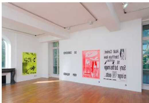
La quinte du loup et le beau tox, MABA

La MABA, créée en 2006 à Nogent-sur-Marne dans l'ancienne maison de maître qu'occupait la peintre Madeleine Smith-Champion, pour promouvoir et diffuser la création contemporaine, encourage l'émergence de projets expérimentaux en privilégiant deux médiums : la photographie et le graphisme, dont elle est l'un des rares lieux de diffusion régulière.