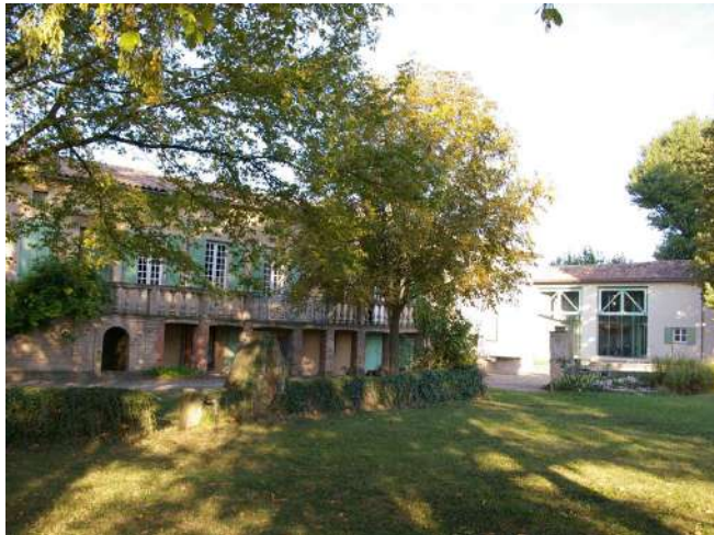
Résidence de Moly-Sabata à Sablons

Depuis 1927, sous l'impulsion du peintre cubiste Albert Gleizes (1881-1953) et de son épouse, la peintre Juliette Roche-Gleizes (1884-1980), Moly-Sabata accueille des artistes en résidence dans une ancienne maison de bateliers du XVIII e siècle, située à Sablons, au sud de Lyon, sur les rives du Rhône.