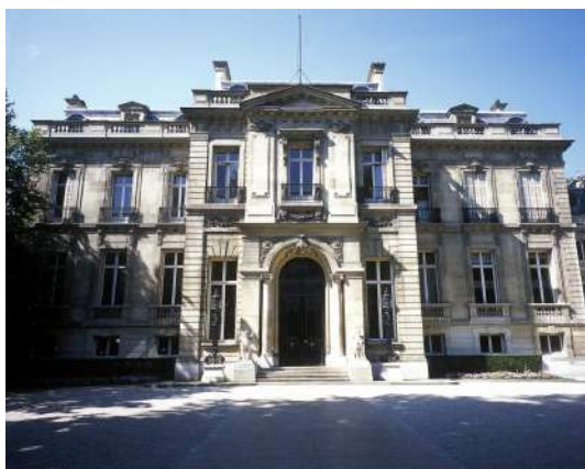
Façade de l'Hôtel Salomon de Rothschild © Fondation des Artistes

L'Hôtel Salomon de Rothschild a été édifié sur l'ancien emplacement de la Folie Beaujon, construite à la fin du XVIII e pour le financier Nicolas Beaujon et dont une partie, l'appartement des bains, sera la dernière demeure dans laquelle vivra Balzac entre 1846 et son décès en 1850. Certains vestiges conservés dans le jardin privé de la demeure témoignent aujourd'hui de ces bâtiments disparus.