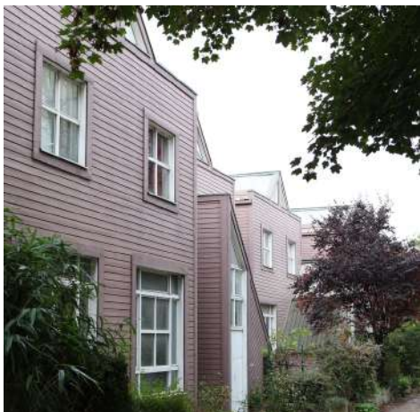
Atelier logements de la cité Guy Loë, Nogent-sur-Marne

Depuis sa création en 1976, la Fondation des Artistes a développé une politique ambitieuse en matière de construction ou d'aide à la construction d'ateliers d'artistes.