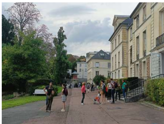
Activités culturelles devant la MABA, Nogent sur-Marne