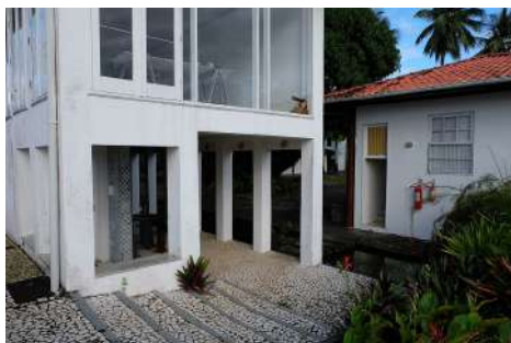
Résidence Sacatar, Brésil

Dans le cadre de sa mission de promotion de la scène française à l'international et en cohérence avec son dispositif de soutien aux jeunes artistes diplômés d'une école d'art, la Fondation des Artistes s'est engagée dans un programme de résidences de création à l'international et dans des initiatives collectives.