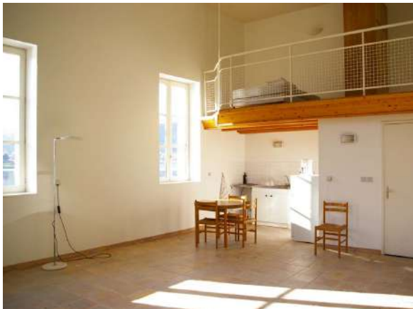
Atelier de Moly-Sabata, (c) Fondation des Artistes

La Fondation Albert Gleizes initie, à sa création, plusieurs évolutions à Moly-Sabata : en 1992, la création de 4 ateliers-logements avec le soutien des collectivités ; entre 1993 et 2007, l'organisation de séjours collectifs d'été, réunissant près de 40 artistes, sous la direction artistique d'un commissaire renouvelé chaque année. C'est en 2010, sous l'impulsion du peintre Pierre David, nommé directeur de la résidence, que se met en place un programme permanent d'accueil d'artistes, avec un réseau de collaborations régionales et internationales.