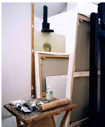
Académie de peinture, Maison nationale des artistes

Créée en 1945, au lendemain de la guerre, administrée pendant de nombreuses années par le peintre Maurice Guy-Loë qui lui donna son caractère actuel, cette maison de retraite accueille de nombreux artistes âgés et des val-de-marnais qui souffrent de solitude ou qui sont confrontés à des problèmes de dépendance.