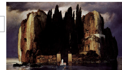
Arnold Böcklin, L'île des morts , 1886.