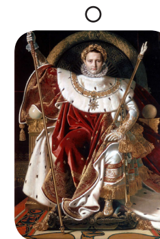
Jean-Auguste-Dominique Ingres, Napoléon Ier sur le trône impérial , 1806.