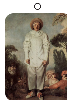
Antoine Watteau, Pierrot , vers 1718 - 1719.