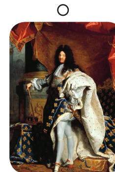
Hyacinthe Rigaud, Louis XIV en costume de sacre , 1710.