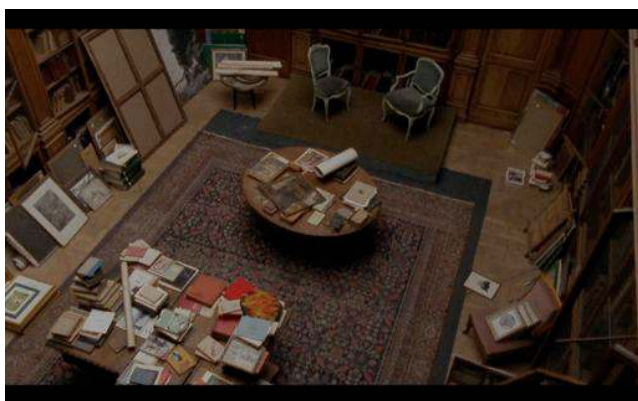
Jessica Warboys À l'étage , 2010 Film 16mm transféré sur support numérique