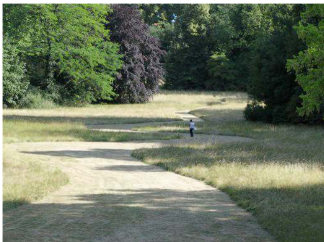
Jason Glasser Vue de l'installation River , Maison d'Art Bernard Anthonioz, 2011