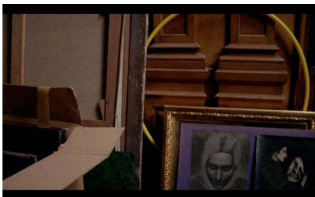
Jessica Warboys À l'étage , 2010 Film 16mm transféré sur support numérique