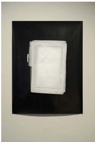
Frédéric Teschner Les Couvertures Muettes , 2011 Vue de l'exposition Le Secret des Anneaux de Saturne , Maison d'Art Bernard Anthonioz, 2011