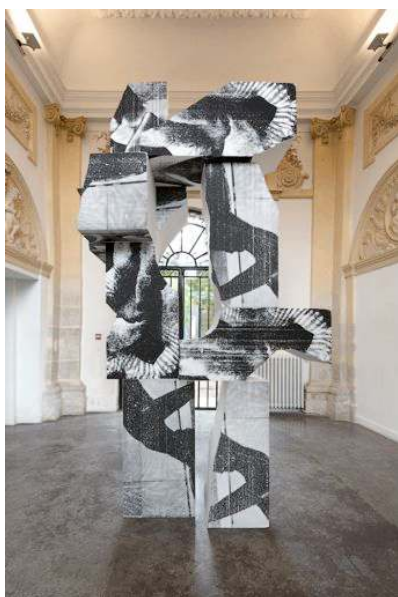
Bastien Aubry & Dimitri Broquard L'Aimable surprise Vue de l'exposition Gitane à la Guitare , Maison d'Art Bernard Anthonioz, 2015