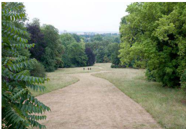
Jason Glasser Vue de l'installation River , Maison d'Art Bernard Anthonioz, 2011