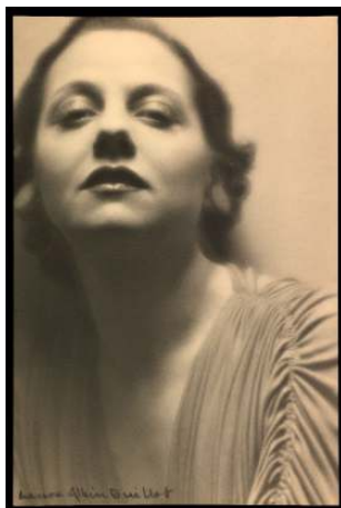
4. Lucienne Boyer (1901-1983), chanteuse et comédienne. Paris, vers 1930.