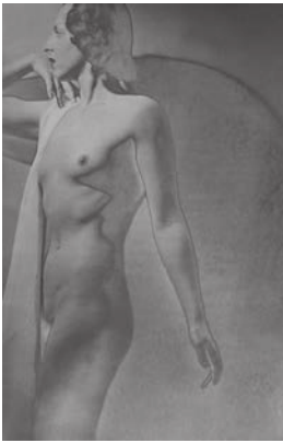
5. Laure Albin Guillot Étude de nu, solarisation . Paris, vers 1930.