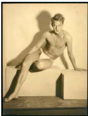
2. Laure Albin Guillot Étude de nu . Paris, vers 1930.