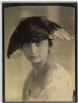
7. Laure Albin Guillot Anna de Noailles (1876-1933), écrivaine et poétesse. Paris, vers 1925.