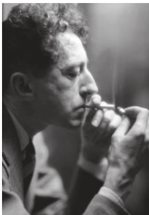
8. Laure Albin Guillot Jean Cocteau (1889-1963), écrivain, 1939.