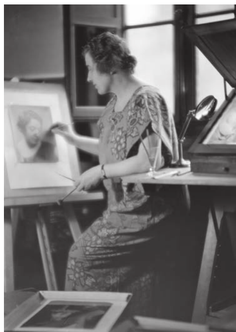
Laure Albin Guillot (1879-1962) dans son atelier. Paris, boulevard Beauséjour, vers 1935.