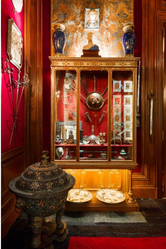
Vue de l'intérieur du cabinet de curiosités de l'Hôtel Salomon de Rothschild