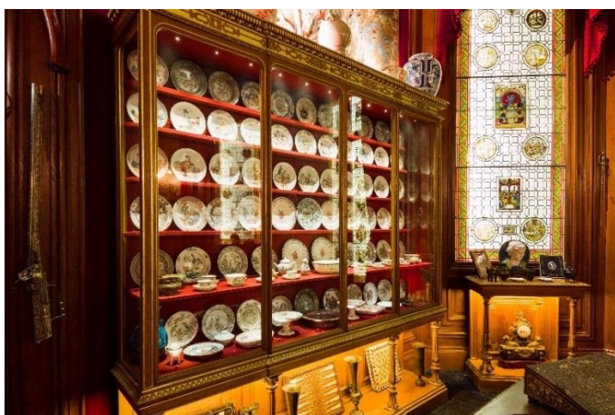
Vue de l'intérieur du cabinet de curiosités de l'Hôtel Salomon de Rothschild