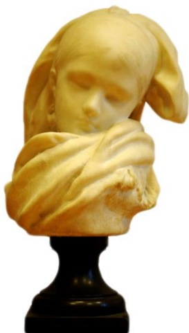
AUGUSTE RODIN, L'Orpheline Alsacienne Après 1871 Marbre

Fondation des Artistes Hôtel Salomon de Rothschild inv. R1538