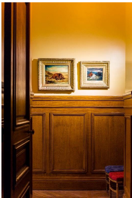
Vue des deux tableaux de Delacroix : Jeune arabe dans la campagne et Lion étreignant un crocodile