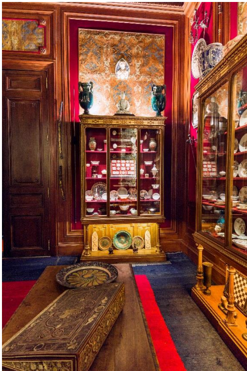
Vue de l'intérieur du cabinet de curiosités de l'Hôtel Salomon de Rothschild