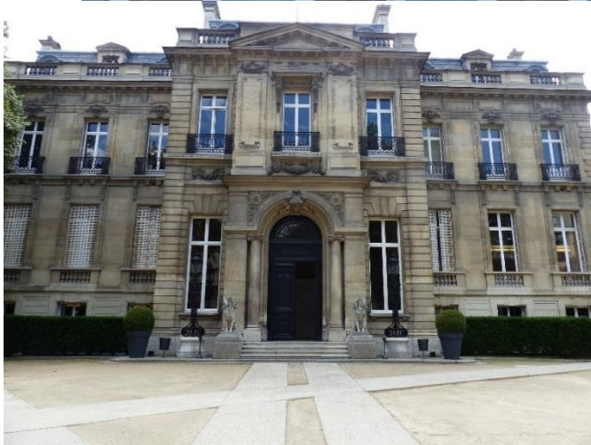
Façade sur cour de l'Hôtel Salomon de Rothschild