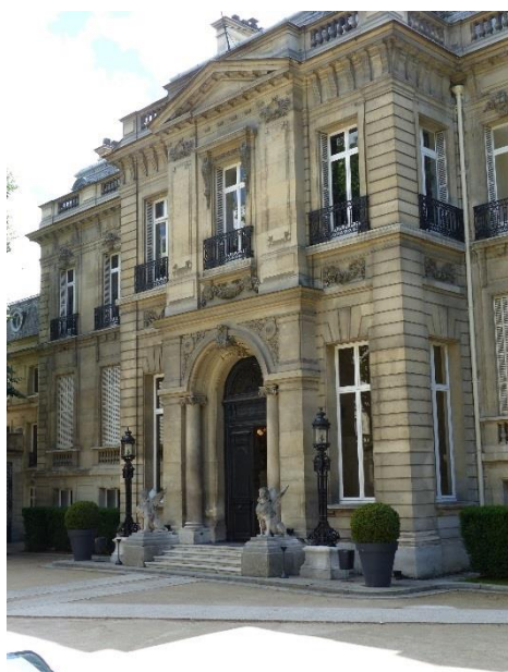
Façade sur cour de l'Hôtel Salomon de Rothschild