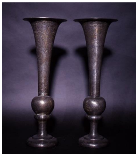
ANONYME IRANIEN, XIX e SIÈCLE Deux vases cornets Alliage d'argent