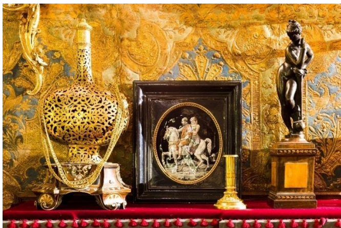
Vue de l'intérieur du cabinet de curiosités de l'Hôtel Salomon de Rothschild avec L'astronomie d'après Giambologna