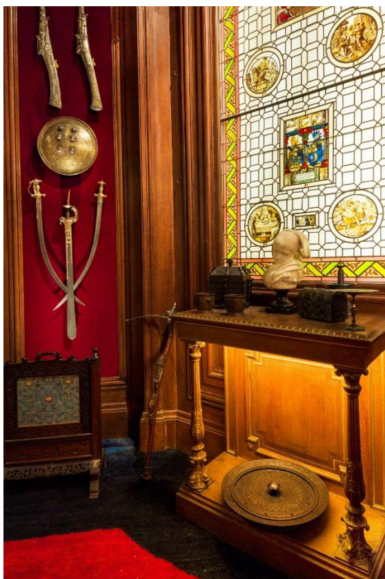
Vue de l'intérieur du cabinet de curiosités de l'Hôtel Salomon de Rothschild