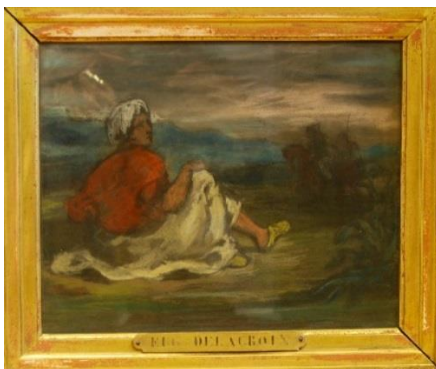
EUGÈNE DELACROIX Jeune arabe dans la campagne Vers 1832 Pastel

Fondation des Artistes Hôtel Salomon de Rothschild inv. R1277