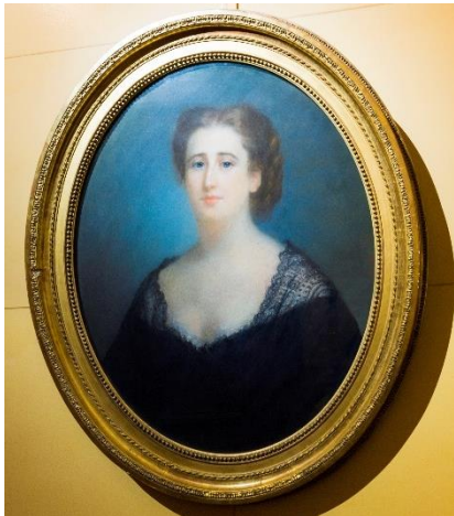
CHARLES ESCOT Portrait de la baronne Adèle de Rothschild 1868 Pastel

Fondation des Artistes Hôtel Salomon de Rothschild inv. R1537