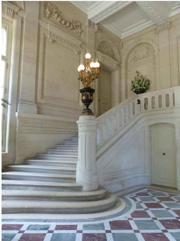
Vestibule de l'Hôtel Salomon de Rothschild