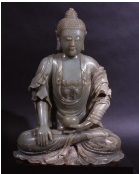
ANONYME CHINOIS, XVIII e SIÈCLE © Fondation Statue du Bouddha de la médecine des Artistes Jade

Fondation des Artistes Hôtel Salomon de Rothschild inv. R1250 à inv. R1269