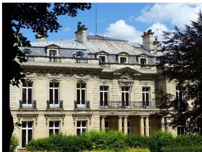
Façade sur jardin de l'Hôtel Salomon de Rothschild