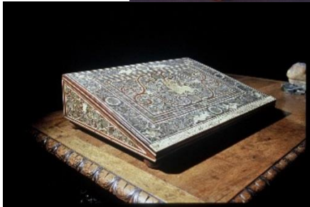
ANONYME VÉNITIEN, XVII e SIÈCLE Ecritoire Noyer incrusté de nacre coloré

Fondation des Artistes Hôtel Salomon de Rothschild R 1280