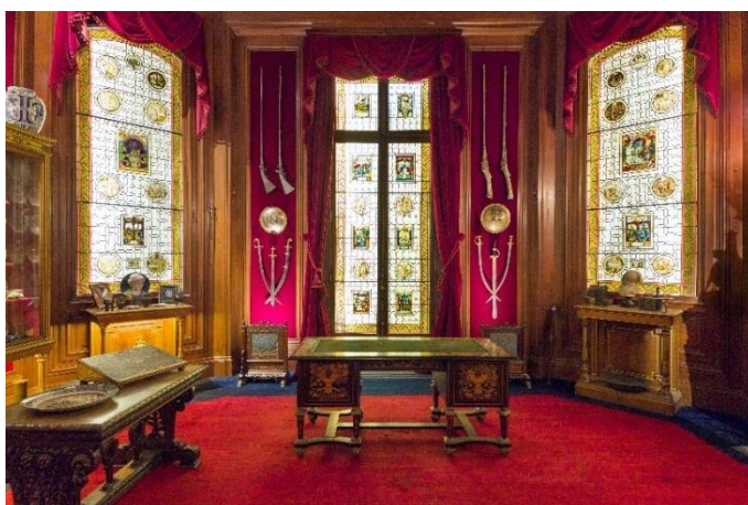
Vue de l'intérieur du cabinet de curiosités de l'Hôtel Salomon de Rothschild