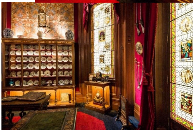
Vue de l'intérieur du cabinet de curiosités de l'Hôtel Salomon de Rothschild