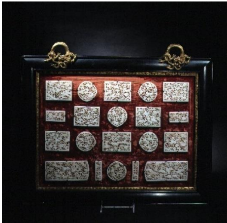
ANONYME CHINOIS, XIX e SIÈCLE © Fondation Ensemble de vingt plaques de des Artistes ceinture en jade à décor ajouré d'oiseaux et de fleurs Jade blanc

Fondation des Artistes Hôtel Salomon de Rothschild inv. R1250 à inv. R1269