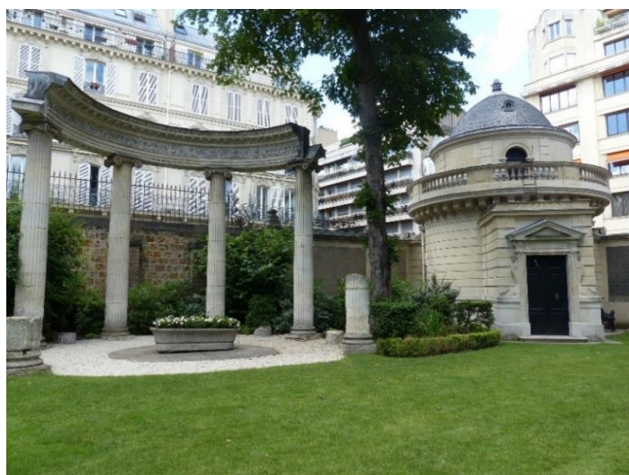
Jardin de l'Hôtel Salomon de Rothschild avec les vestiges de l'ancienne Chapelle Saint- Nicolas de la Folie Beaujon et la Rotonde Balzac