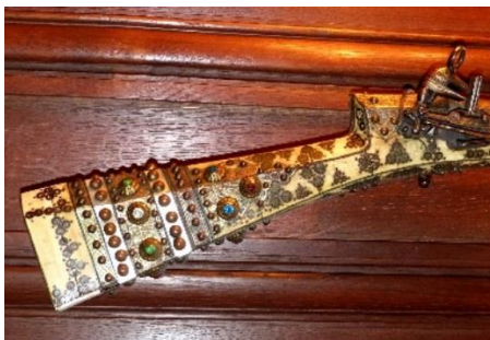
ANONYME TURC, FIN DU XVIII e SIÈCLE © Fondation Détail du manche d'un fusil Tufek des Artistes Ivoire teinté, bronze, or, pierres

Fondation des Artistes Hôtel Salomon de Rothschild inv. R1236