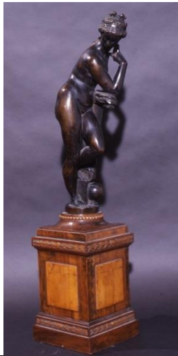
GIAMBOLOGNA, atelier L'Astronomie Fin XVI e – début XVII e siècle Bronze