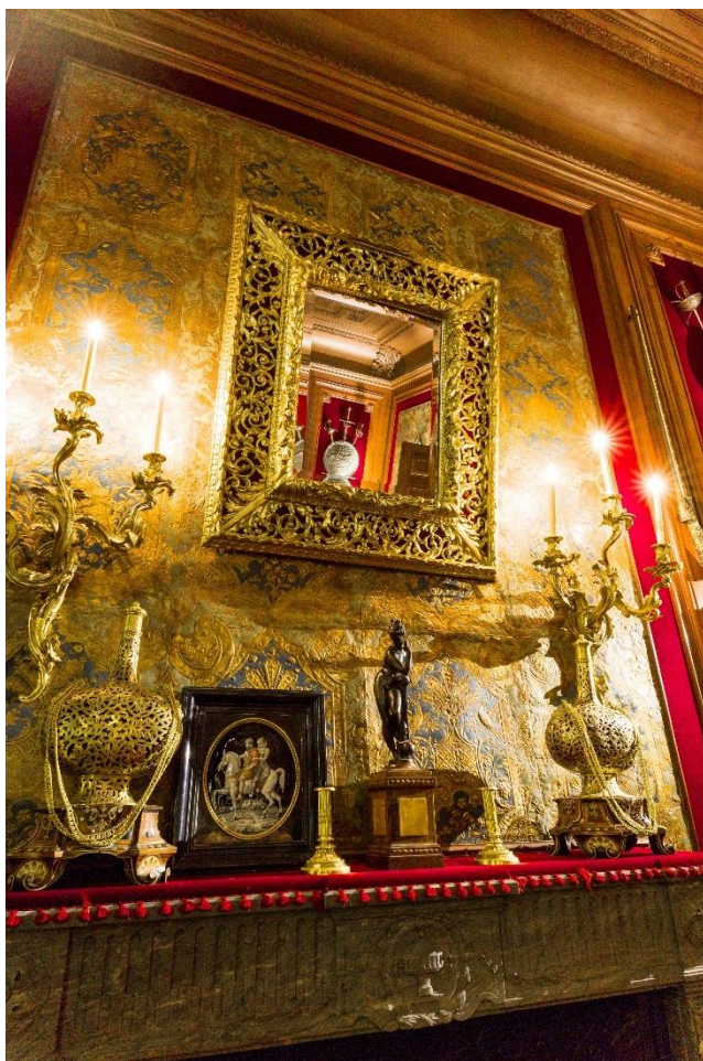
Vue de l'intérieur du cabinet de curiosités de l'Hôtel Salomon de Rothschild