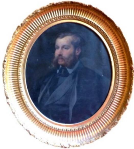
ANONYME FRANÇAIS, XIX e SIÈCLE © Fondation Portrait du baron Salomon de Rothschild des Artistes Huile sur toile

Fondation des Artistes Hôtel Salomon de Rothschild inv. R1537