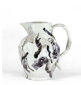
Aubry Broquard Cruche Nr. 32, 2012 Porcelaine peinte et émaillée 29 x 28 x 24 cm