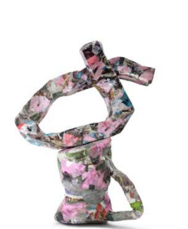
Aubry Broquard Home Depot, 2014 Papier maché, impression numérique 80 x 50 x 40 cm