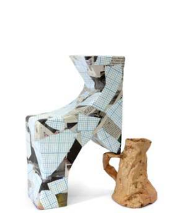
Aubry Broquard Home Depot, 2014 Papier maché, impression numérique 50 x 30 x 20 cm