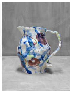
Aubry Broquard Cruche Nr. 9, 2012 Porcelaine peinte et émaillée 25 x 25 x 18 cm Courtesy des artistes