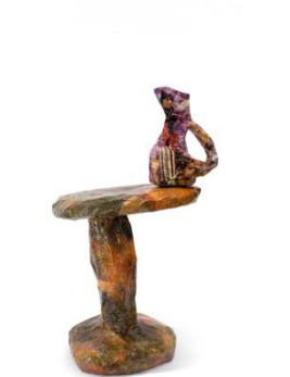
Aubry Broquard Home Depot, 2014 Papier maché, impression numérique 120 x 80 x 80 cm