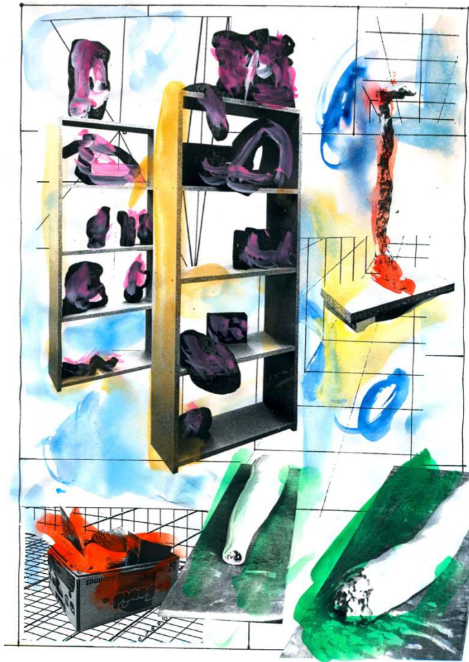
Aubry Broquard, La vie pratique , 2015. Impression sur papier, couleur acrylique, 29,7 x 21 cm. Courtesy des artistes

MAISON D'ART BERNARD ANTHONIOZ NOGENT-SUR-MARNE DU 3 SEPTEMBRE AU 18 OCTOBRE 2015